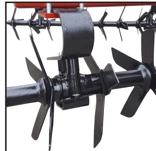
Die serienmäßig gefederte Aufhängung der Messerwellen schützt zuverlässig vor Überbeanspruchung

Achtung! Beim Transport auf öffentlichen Straßen bitte die STVZO beachten! Alle Abbildungen und Daten sind annähernd und unverbindlich!